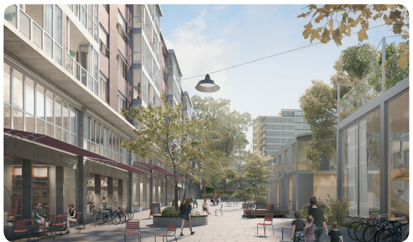
nightnurse images | Enzmann Fischer Partner

Die Baugenossenschaft wohnen&mehr arbeitet bei der Entwicklung des Westfeld-Projekts mit Vereinen, Sozialinstitutionen und Wohngenossenschaften eng zusammen, so beispielsweise mit der Bau- und Wohngenossenschaft «Lebenswerte Nachbarschaft LeNa», die auf dem Westfeld ein Gebäude in Generalmiete übernehmen wird. Die Quartierbevölkerung und Quartierakteure wie das Stadtteilsekretariat Basel-West, die Bildungslandschaft Wasgenring, die IG Dynamo Westfeld und der Neutrale Quartierverein Kannenfeld beteiligen sich aktiv an der Entwicklung. Eine enge Zusammenarbeit besteht auch mit künftigen Nutzern auf dem Westfeld, so etwa mit dem Bürgerspital Basel, der Pro Senectute beider Basel, dem Erziehungsdepartement Basel-Stadt (Doppelkindergarten) und dem Betreiber der Kindertagesstätte. Dieser kooperative Planungsansatz ist ein wesentlicher Bestandteil der Durchmischung und der langfristigen Sicherung der «sozialen Biodiversität».