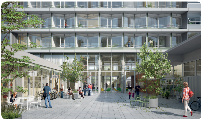
Müller Sigrist Architekten | Rapp Architekten

Die erste Bauetappe des Westfeld beinhaltet rund 430 Wohnungen in Neubauten und im umgenutzten Spitalgebäude. Die Kosten werden mit CHF 220 Mio. veranschlagt. Die Gesamtkosten inklusive zweiter Bauetappe mit nochmals 70 Wohnungen betragen rund CHF 250 Mio. Zu den Eigenmitteln zählt, neben dem Substanzwert der Bestandesbauten, das von beteiligten Wohngenossenschaften und künftigen Mietern eingebrachte Genossenschaftskapital. Dazu kommen Spenden an spezifische, soziale Teilprojekte sowie die Finanzierung der öffentlichen Flächen aus dem Mehrwertabgabefonds des Kantons Basel-Stadt. Die Fremdfinanzierung teilt sich auf in Darlehen von Mitgliedern, Mittel aus dem Fonds de Roulement, EGW- sowie Bankenfinanzierung. Insbesondere für die Realisierung gemeinschaftlicher Flächen und die Äufnung des Solidaritätsfonds zählt wohnen&mehr auf die Kooperation mit Partnern.