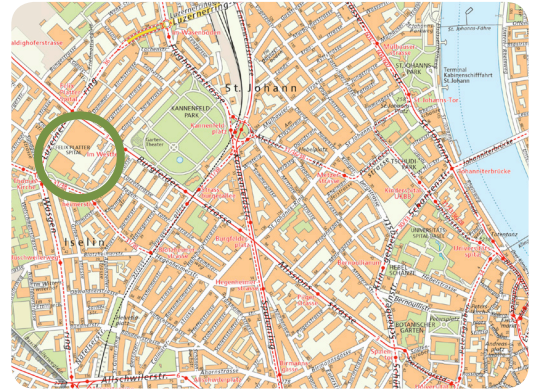
Grundbuch- und Vermessungsamt Basel-Stadt

Auf dem bis anhin vom Felix Platter-Spital genutzten Areal wächst im Westen Basels ab 2019 ein lebendiges, neues Stück Stadt. Unter dem Namen Westfeld entsteht nicht nur genossenschaftlicher, sozial durchmischter Wohnraum für rund 1'200 Bewohnerinnen und Bewohner. Vielmehr entsteht ein eigentliches Quartierzentrum mit hoher Lebens- und Aufenthaltsqualität. Das Westfeld-Projekt ist eine Antwort auf die Wohnungsknappheit und den vielfach geäusserten Wunsch der Bevölkerung in Basel-West nach einem identitätsstiftenden Ort der Begegnung. Darüber hinaus bietet das Westfeld exemplarische Antworten auf die Frage, wie wir in Zukunft wohnen werden.