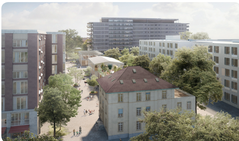
nightnurse images | Enzmann Fischer Partner

Das 35'000 Quadratmeter grosse Spitalareal wird Mitte 2019 vom Kanton Basel-Stadt im Baurecht an die Baugenossenschaft wohnen&mehr abgegeben. Auf dem Transformationsareal, neu Westfeld genannt, entstehen in Neubauten und im umgenutzten, denkmalgeschützten Felix Platter-Spital über 500 Wohnungen. Der Wohnraum dient verschiedenen Generationen und Bedürfnissen. Er umfasst Alterswohnen mit Service, Studios für Wohnen und Arbeiten, Single- und Paarwohnungen, familienfreundliche Grosswohnungen bis hin zur innovativen Clusterwohnung.