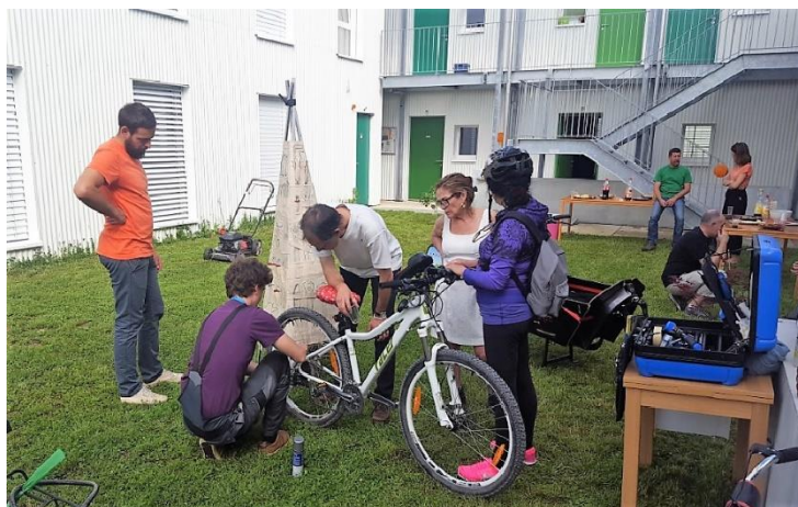
Atelier de réparation de vélos