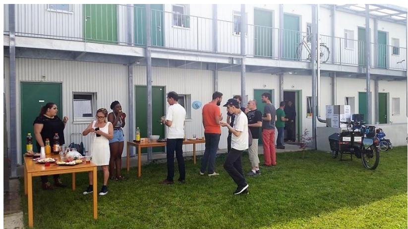
Fête des voisins

De surcroît, la possibilité de déplacer ce bâtiment sur un autre terrain à la fin du DDP, ou de recycler ses modules, permet de faire évoluer cette solution de logements temporaires afin de répondre aux besoins spécifiques du moment .